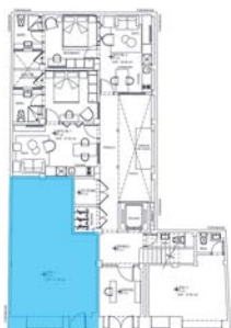
PLANTA NIVEL PB