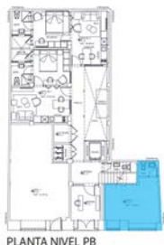
PLANTA NIVEL PB