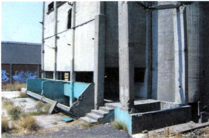
PARTE POSTERIOR EDIFICIO INDUSTRIAL