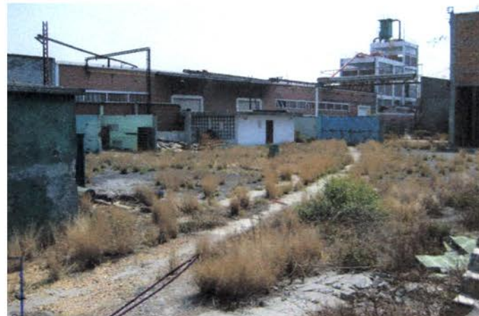
ANTIGUA TRAYECTORIA VIA FERREA