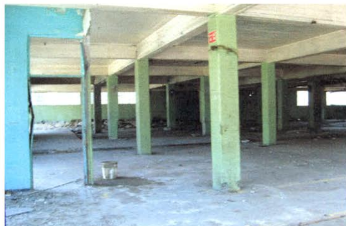
EDIFICIO DE MAQUINARIA