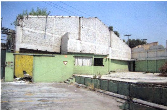
VOLADOS DE CONCRETO