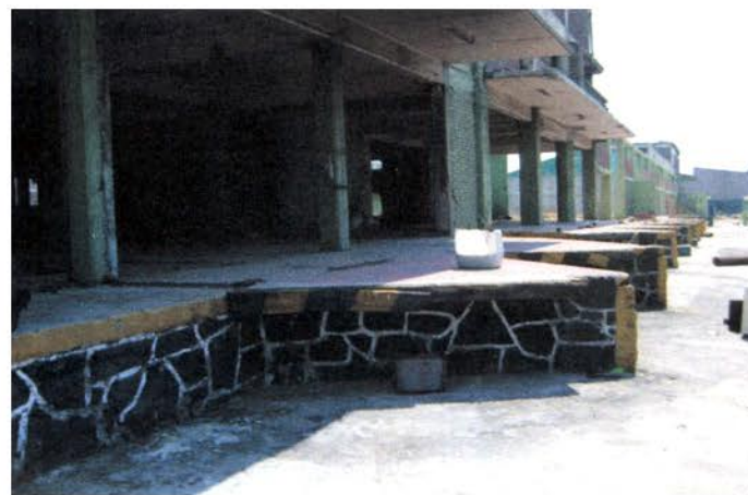
CUBIERTA INDUSTRIAL CARGA Y DESCARGA