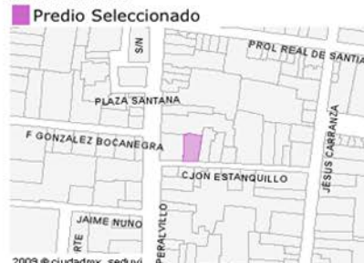
Ubicación del Predio

Este croquis puede no contener las últimas modificaciones al predio, producto de fusiones y/o subdivisiones llevadas a cabo por el propietario.